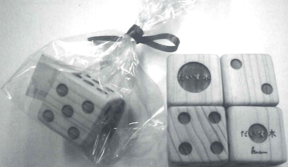
幅 30mm×高さ 30mm 税込価格 ¥750(1個)