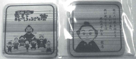
幅83mm×長さ83mm×高さ5mm 税込価格 ¥300(1枚)