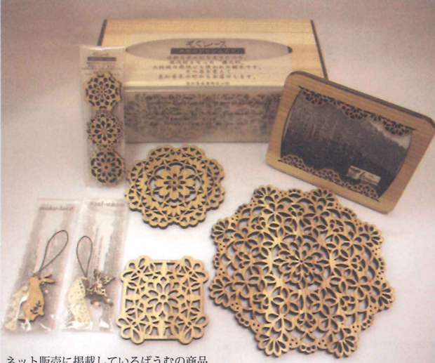
ネット販売に掲載しているばうむの商品

4月から新たにインターネットでの商品販売を、外でも販売していきたく行こうとなった。このと考えていた。そして今、インターネット販売は全回、このサイトに携わる市本町にある老舗、本池は、高知行こうことで、自社だけで、高知新聞社の方とばうむ村農協の「つくん馬路村」に商品を手にとつて、し、「株式会社47CLUB」社員が偶然にも知人だつたことにより、管理運営をしていただくこともあり、その方を紹介されたことにより、通販サイト「47CLUB」を通じてネットでの商品販売が紹介されている。 「47CLUB」では全国くレスシリーズ」のコーだき、そして嶺北と県外話やFAX、メールをい、各地の地域の名産品や特産品、伝統工芸品など、厳選された逸品」をサイトており、今後は自社製品だも受け付けていたが、以選された逸品」をサイトており、今後は自社製品だも販売したいということ、嶺北の総合商社」の地域のおススメ商品を掲載する予定である。 と、嶺北の総合商社」の地域のおススメ商品を掲載する予定である。このインターネット販売