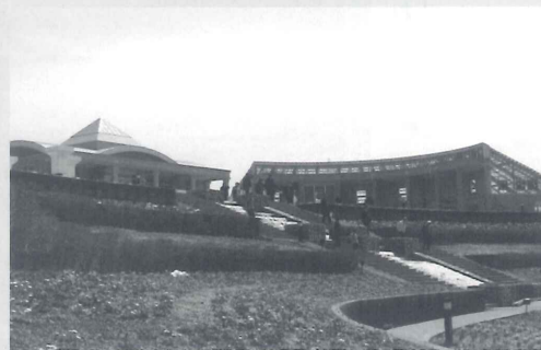
リニューアルオープンした「ゆとりすとパーク」

指定管理者変更に伴い合わせ、キャッチフースを新たに「風とルオープンをした「ゆあそぶ」とし、四季折々の花が楽しめるよう、装いを一新した。園内には約5万株の花々を入れ、四季に順じて花を入れ替えていく予定で、他にも、温室ハウスには新たにラン科の花々を追加し、果実、ハーブ類や、サボテンなどの植物をエリアごとに鑑賞できるようにになっている。先月9日に開催されたオープニングセレモニーでは、baum llcが製作したオリジナルコースターが限定100名に記念贈呈され、温室ハウスには特製看板も設置されている。今後ばうむとしても「ゆとりすとパーク」をさらに盛り上げていければ良いと考えている。