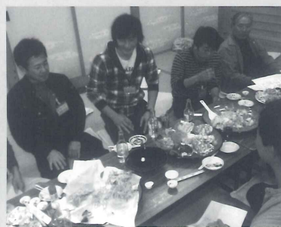
昨年に開催された「森のおきやく」の様子

昨年の10月から今年の前回開催することになった。2月まで開催され、昼は前回好評だった田植え体験や、田植え体験、体験や椎茸のコマ打ち体験をし、夜は楽しく大宴会、山見川地域に古くか山のおきやく。そのおきやくら伝わる伝統漁法「しゃくが今月21日から前回より漁の体験や、山狩師りもさらにダイープになる猪や鹿を獲る仕掛けを見学するといったプログラムも企画されている。今回のスケジュールには「ダイープな二次会」なるものも加わっており、前回同様おおいに盛り上がることは間違いなくである。