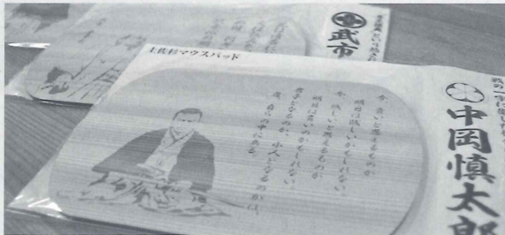
「土佐幕末英雄シリーズ」マウスパッド

現在のシリーズとして坂本龍馬、岩崎弥太郎、中岡慎太郎、武市半平太といった幕末期に活躍した偉人の王佐幕末英雄シリーズ