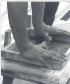
和紙の貼りの様子