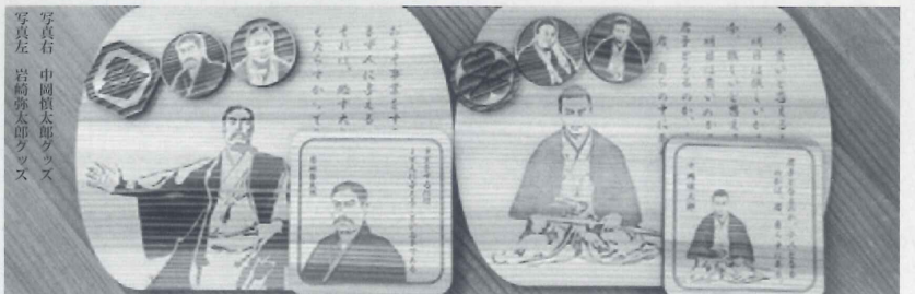
写真右 中岡慎太郎グッズ 写真左 岩崎弥太郎グッズ

今後新たに、地元の偉人や昭和期に活躍した高知県出身の人物等も発売する予定で、「商品を手取る際、その偉人の言葉の意味や、活躍した時代背景についても想像を膨らませて頂ければと思う。」と同商品製作者は話している。