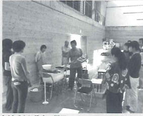
和紙づくり教室の様子

以前から本山町では楮(地元ではカジと呼ばれる)が多く穫れ、和紙の原材料として出荷していたが、原材料としてだ