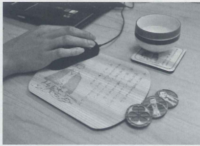
中岡慎太郎のコースター、マグネット、マウスパッド

高知県出身の偉人をマウスパッド、コースター、マグネット、ノートにデザインした「土佐偉人列伝」が6月17日からばうむの新商品として本格的に