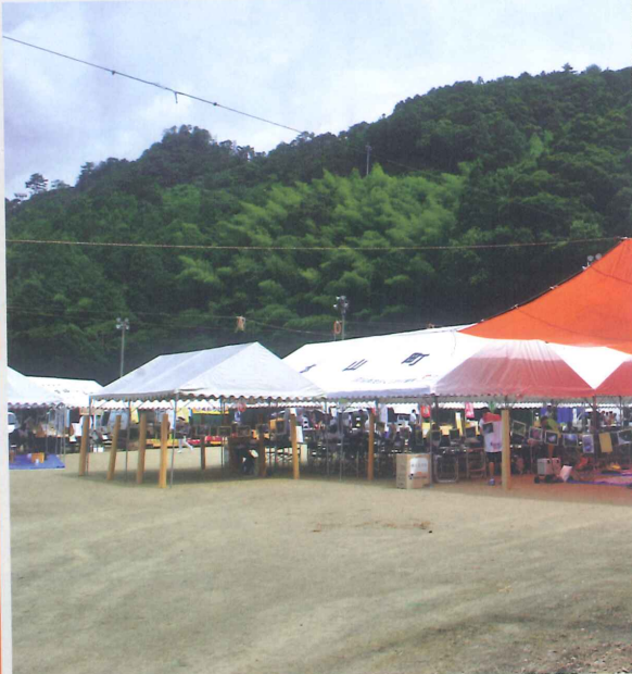
イベント会場の様子

7月31日、本山町の吉野運動公園にて「SLOW2011」が開催された。このイベントは、毎年夏に開催される「汗見川清流マラソン」のランナーに「嶺北のツクかき氷やジュースを販売魅力」を伝えることを目的に、昨年から自社が企画・運営をた。今年、本山町や土佐町の個人や企業を含む12店に出店して頂き、来場者は清流マラソン参加の県外ラ