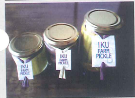
いく農園のピクルス

昭和54年1月26日生まれ、大阪府出身。高知大学へ進学。大学卒業後、本山町で有機農業を学び、2年前土佐町相川へ移住し「いく農園」を立ち上げる。現在農業を行いながら自家製ピクルスを製造しており、地元のみならず県外へも広く販売を行っている。