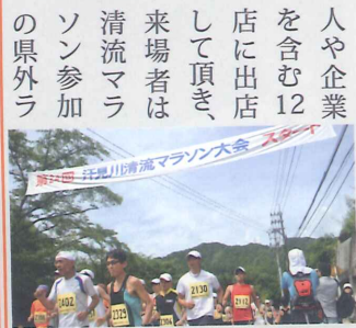
清流マラソンスタートの様子

7月31日、本山町の吉野運動公園にて「SLOW2011」が開催された。このイベントは、毎年夏に開催される「汗見川清流マラソン」のランナーに「嶺北のツクかき氷やジュースを販売魅力」を伝えることを目的に、昨年から自社が企画・運営をた。今年、本山町や土佐町の個人や企業を含む12店に出店して頂き、来場者は清流マラソン参加の県外ラ