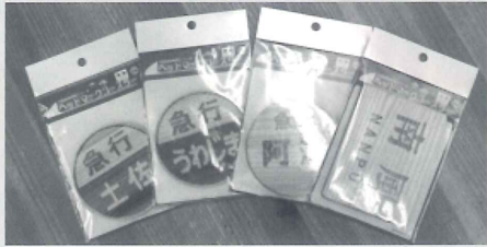
JR四国ヘッドマークコースター

JRグッズは高知県産杉材にJR四国の鉄道車両である2000系、8000系の2車両を刻印したもので、コースター、マグネット、ストラップ、「南風」や「土佐」といったヘッドマークコースターの全11種類がある。