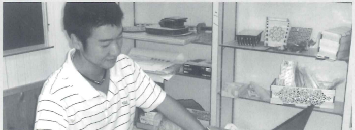
ネットショップを更新するインターン生

とで、商品製造現場や製品販売のしくみを知るといった意見があり、多くの学んだ様子だった。 という目的の下、製造補助や、自社のネットショップ更新作業をおこなってもらった。 製造補助では、慣れない作業でずいぶん苦戦していたが、それでも懸命に励んでいた。 今回のインターンシップを通して研修生からは「今回の目標であった、顧客と商品価値について知ることができた。」「嶺北の森林事業について様々な情報を得ることができた」