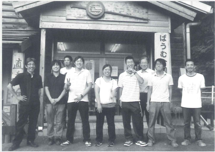
インターン生とばうむ社員

8月17日から2週間で、商品製造現場や製品販売のしくみを知るといった意見があり、多くの学んだ様子だった。 間、自社に2名のインターン研修生が来ることとなった。これは、NPO法人「人と地域の研究所」が行う「いなかインターンシップ」で、その中のプログラムのひとつとして受け入れの依頼があった。 インターンシップとは、企業などへ赴き、その現場を学ぶ就業体験のことである。研修生は高知工科大学マネジメント学部2年生というこ