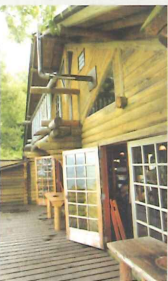
ベランダからの様子

8月は予約でいっぱいになる程の盛況ぶり。愛媛県や香川県をはじめ関西圏からの宿泊客が中心だが、東京や千葉県といった遠方から訪れるお客さんもいる。来客者からは「風景がとても素晴らしい」と「獲れたての野菜を使つての料理がおいしい」という意見が多かった。8月にはテレビ取材があり、